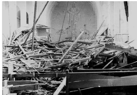
Nach dem Bombenangriff 1944