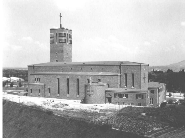
Vor dem Krieg (Rückansicht)