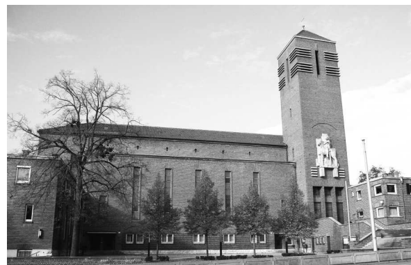
St. Georg heute (Vorderansicht)